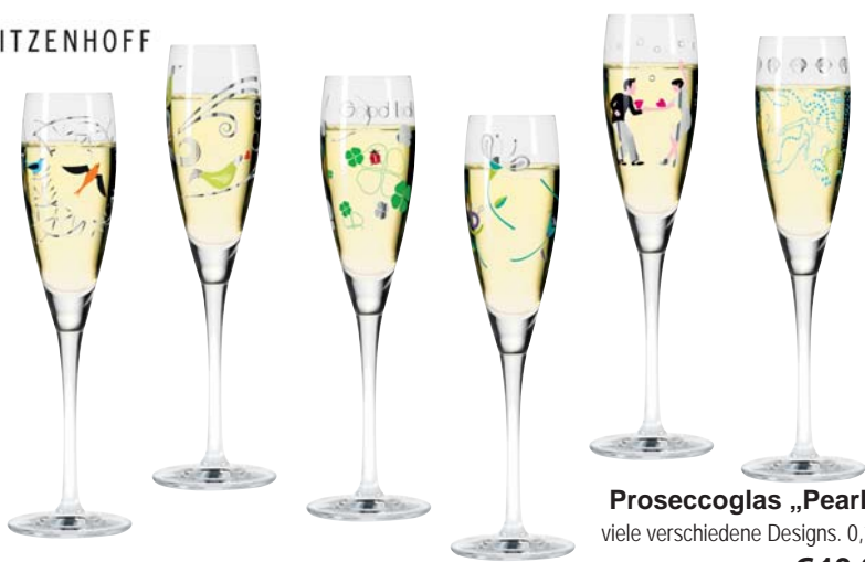
Proseccoglas „Pearls“ viele verschiedene Designs. 0,16L je €19,95

Dieser Artikel ist in der Filiale CUISINARUM erhältlich.